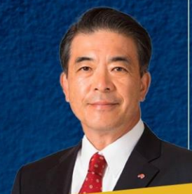
味の素株式会社 特別顧問